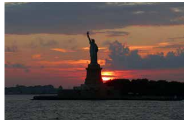
Por do Sol na Estátua da Liberdade - EUA

ta humildade: “pois em fotografia, como em outras áreas, você tem sempre o que aprender”, afirma.