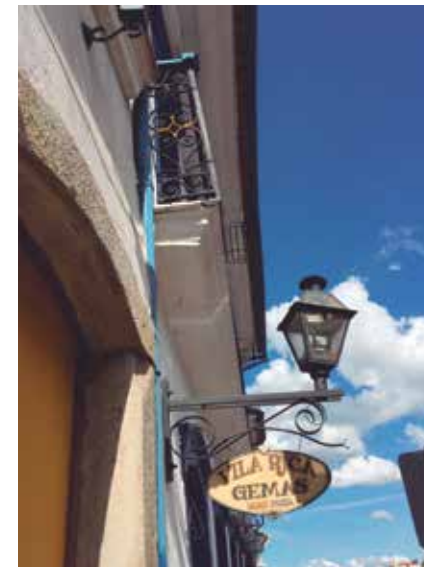
Pelas ruas de Ouro Preto - MG

Aos que pretendem seguir a carreira de fotografia, ele indica muito estudo, muita prática e mui-