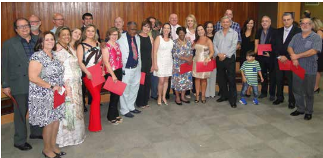
Eleitos, após a posse, no auditório Teotônio Vilela

Presidente Rita vai usar experiência de gestões anteriores na defesa do servidor