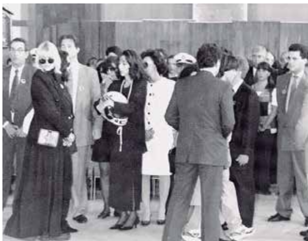
Velório de Ayrton Senna