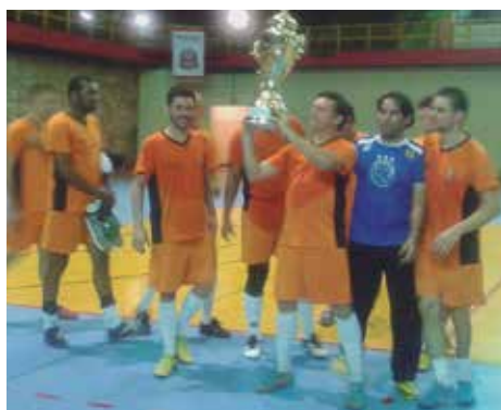
Time campeão masculino

Os locais que receberam os oito times masculinos e os dois times femi-