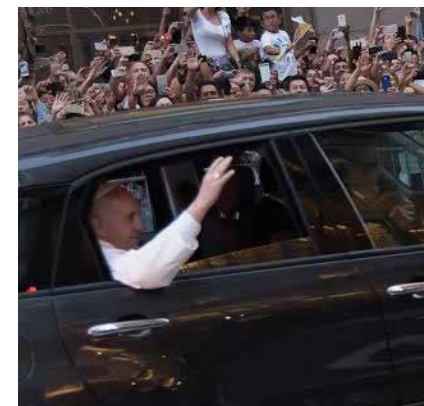
Atento, registra o Papa Francisco em NY