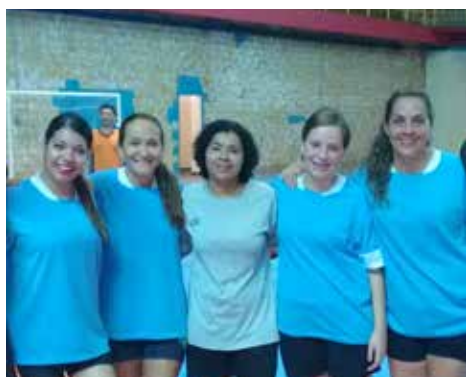
Time campeão feminino

Em 27 de outubro de 2015, foi realizada a final do torneio de Futsal 2015, promovido pelo Departamento de Recursos Humanos (DRH), com o apoio da Afalesp, da Cooperalesp e do Sindalesp.