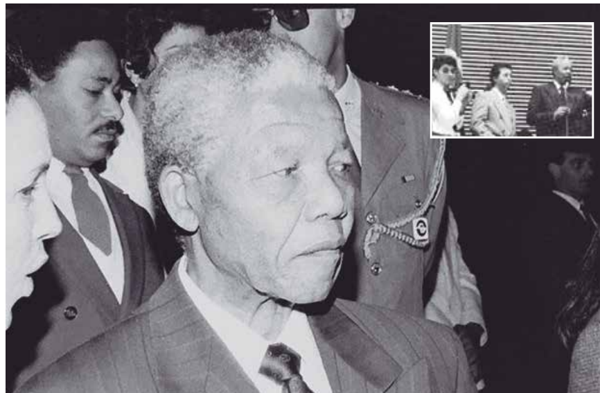
Maurício registra a visita de Nelson Mandela à Assembleia (detalhe)

Ele já ministrou duas oficinas de fotografia na Casa, que foram muito elogiadas pelos participantes e um curso com quatro aulas. Segundo ele, a experiência das oficinas foi bastante positiva, mas a restrição do tempo atrapalhou um pouco o resultado. “Foram muito bacanas as duas oficinas, onde foi possível dar orientação sobre o uso dos equipamentos, entre outros, mas a didática acabou comprometida pela falta de tempo para isso. O