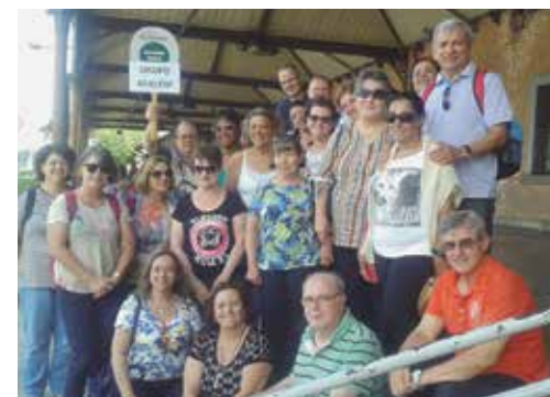
Turma do passeio

Estação da Luz, no centro histórico de São Paulo, às 8h30, com destino a Jundiaí. De lá, os integrantes partiram em um micro-ônibus rumo ao circuito. O turismo rural do local é feito por diversas propriedades localizadas em cada município, que optam por colher e dividir com os visitantes os belos frutos que aquela região, potencial em produção, oferece.