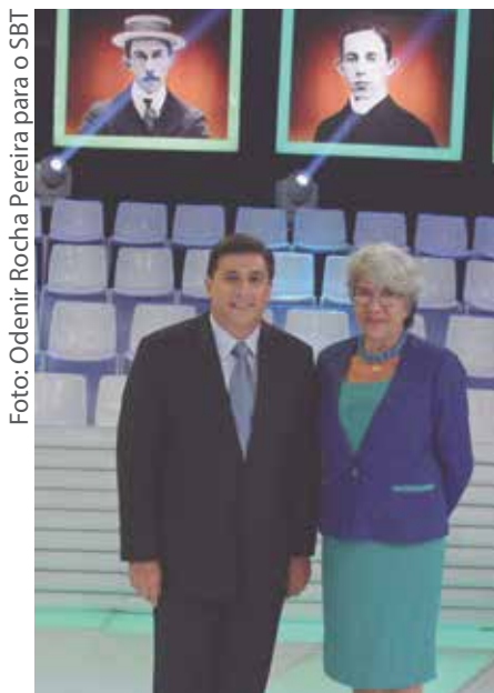
Carlos Nascimento e Laurete Godoy

Laurete pretendeu com a obra alçar o leitor a um “voo literário em que poderá também visitar algumas páginas da História do Brasil”. Um exemplo, é a história da Revolução Constitucionalista de 1932, que deu origem à deno-