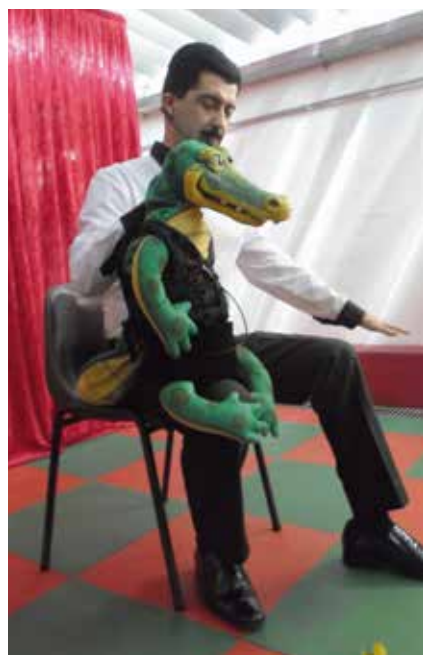
Teatro de fantoche na Semana da Criança