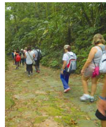
Calçamento construído no século 18