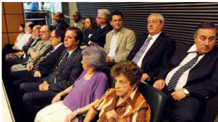
Representantes de diversas entidades do funcionalismo no evento da Apampesp