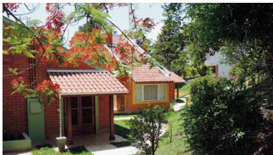
Mudança de design dos chalés proporcionou novo espaço visual