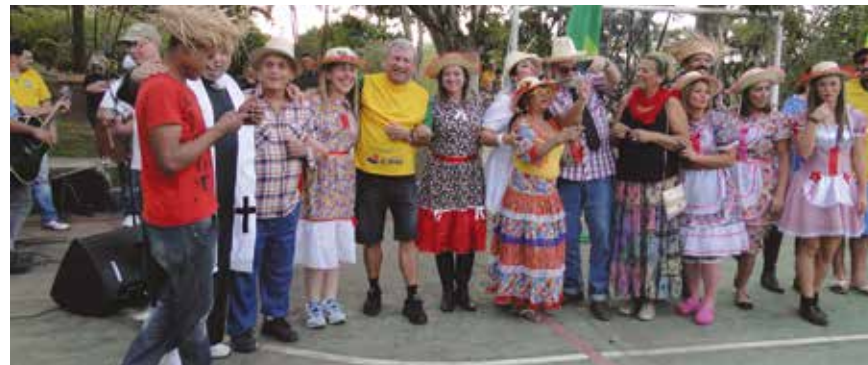
Funcionários dançam a tradicional quadrilha em Socorro

Não perca a Festa de Natal das Crianças Especiais, que a Assembleia realiza anualmente e que conta com o apoio e trabalho voluntário de funcionários, do efetivo da Polícia Militar, da Afalesp e do Sindalesp, entre outros. Neste ano, a festa será no dia 13/12, no Hall Monumental. Voltada a crianças carentes e portadoras de diversos males, como paralisa cerebral, síndrome da imunodeficiência adquirida, HIV, síndrome de Down e câncer, a festa chega a receber a participação de 25 instituições e a presença de cerca de 2.500 crianças.