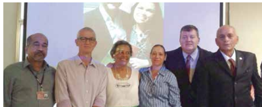
Entidades que representam os servidores prestigiaram a sessão