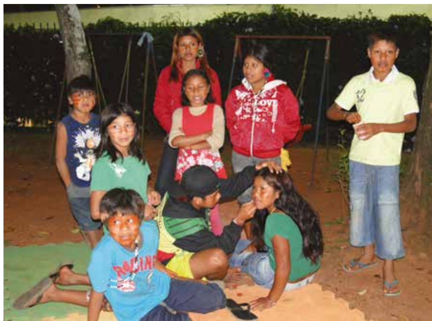
Creche da Casa recebe crianças de tribo indígena para comemorar o Dia do Índio