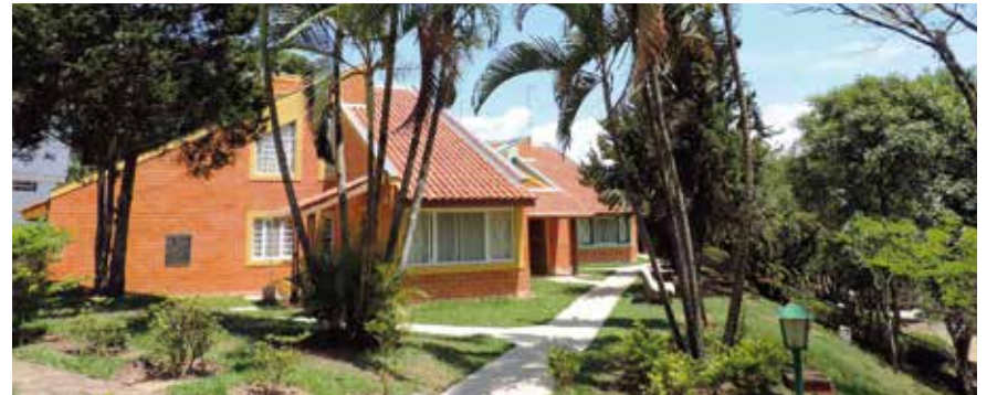
Chalés receberam melhoria no acabamento e design

Tetos receberam massa e pintura, caixilhos totalmente revisados pintados. As portas de madeira foram recuperadas e envernizadas, troca das