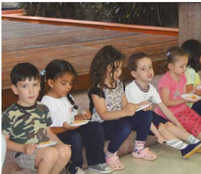
Crianças da Creche da Casa se deliciam com bolo distribuído pela Afalesp

Programe-se para férias de janeiro nas colônias: