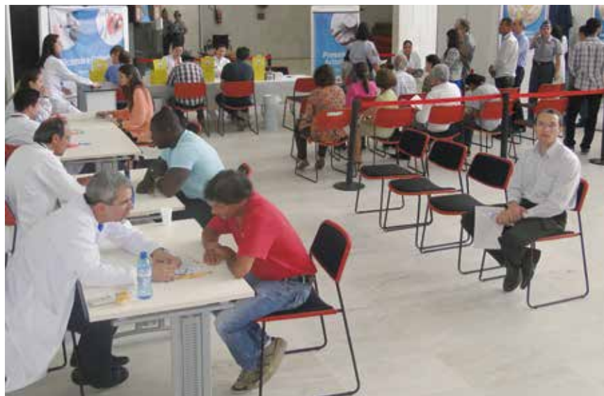
Evento recebeu grande número de servidores