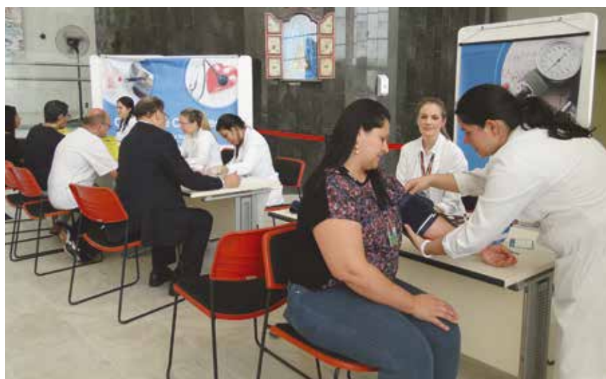
Objetivo da Semana é disseminar a cultura da prevenção