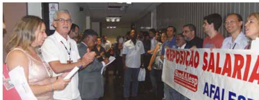
Mobilização de servidores durante campanha

Chefinhos - Para quem não acompanhou a história, os antigos ocupantes do cargo de Chefe de Seção e de Encarregado de Setor não receberam na Resolução 776/96 o devido tratamento e ficaram prejudicados. Após intensa luta das entidades, essa distorção foi sanada no PLC 10/2014, aprovado pela Assembleia, porém vetado, justamente na parte que contemplava esses servidores, pelo governador. A primeira providência das entidades diante desse fato foi tentar convencer os membros da Mesa da necessidade da derrubada desse veto. Sem sucesso nessa negociação, foi apresentada à Mesa uma minuta de um Projeto de Resolução, propondo resolver a questão mediante reenquadramento, reclassificação e revalorização das gratificações. Infelizmente, o presidente da As-