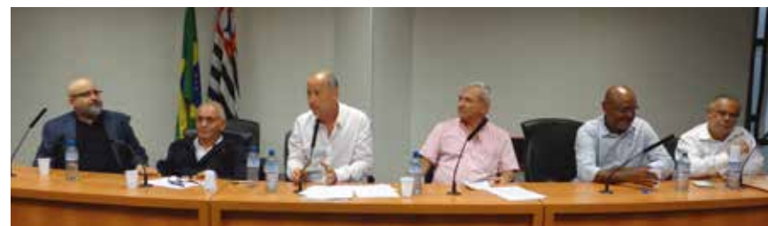
Mesa dos trabalhos na Assembleia Geral

No último dia 23 de março, assembleia geral da Cooperalesp elegeu nova diretoria da instituição para o biênio 2015/2017. Além da eleição, foram aprovadas pela maioria dos presentes a reforma do Estatuto Social, para torná-lo mais adequado ao crescimento da cooperativa nos últimos anos, além das contas do exercício de 2014, a destinação da verba do Fates e das sobras havidas no período. Foram discutidas, ainda, a campanha de subvenção à compra de óculos e as medidas tomadas pela diretoria, nos últimos dois anos, destinadas