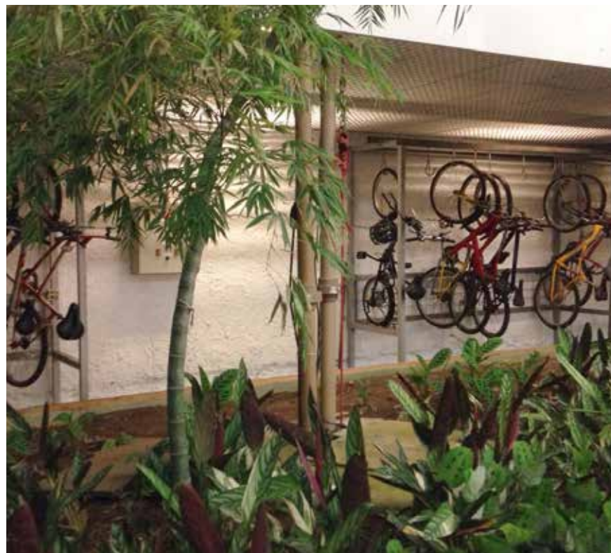
Bicicletário da Alesp

Significa um caminho, sinalizado ou não, que represente a rota recomendada para o ciclista chegar onde deseja. Representa efetivamente um trajeto, não uma faixa da via ou um trecho segregado, embora parte ou toda a rota possa passar por ciclofaixas e ciclovias.