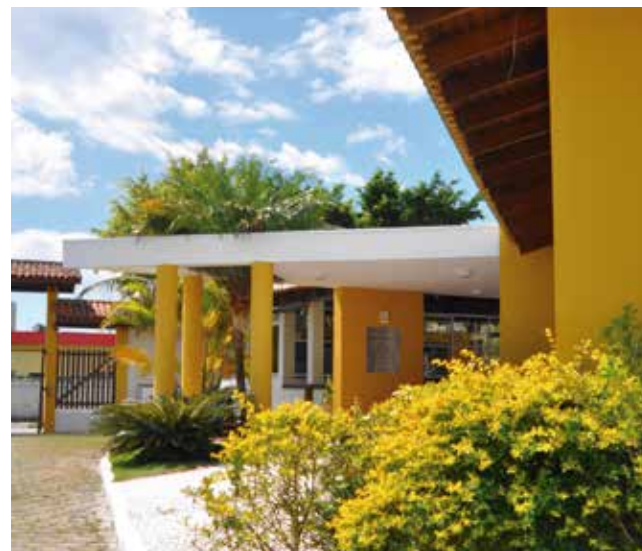
Colônia de Caraguá

próximo. Será construída, ainda, mais uma churrasqueira. Com isso, será finalizada a revitalização dos 16 chalés de Socorro.