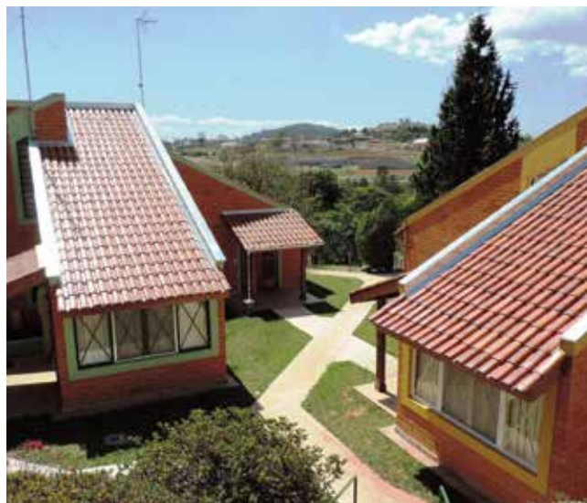
Chalés em Socorro

Após revitalização completa e ampla reforma, foram entregues os chalés da Colônia de Socorro números 5, 6, 7 e 8 e iniciadas as obras nos chalés 1, 2, 3 e 4. Estes, com entrega prevista para junho