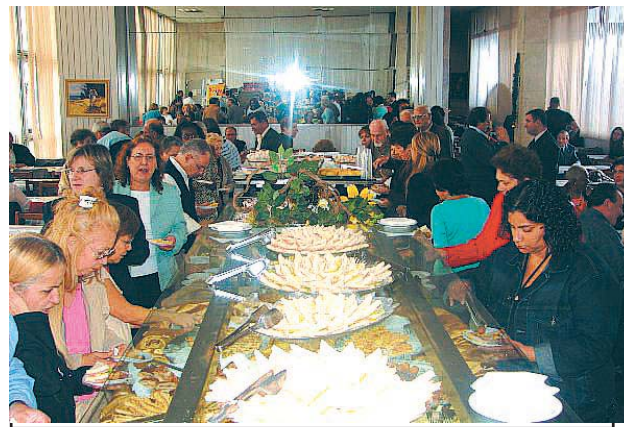
Chá dos Aposentados