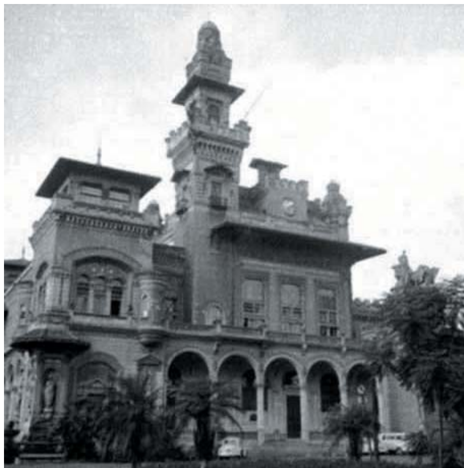
A AFALESP foi fundada no Palácio das Indústrias, no Parque D. Pedro,...