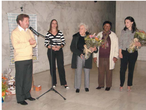
Festa do Dia das Mães