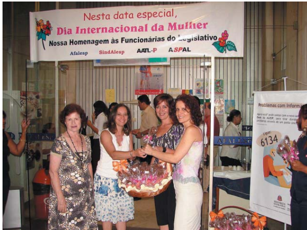
Homenagem ao Dia Internacional da Mulher