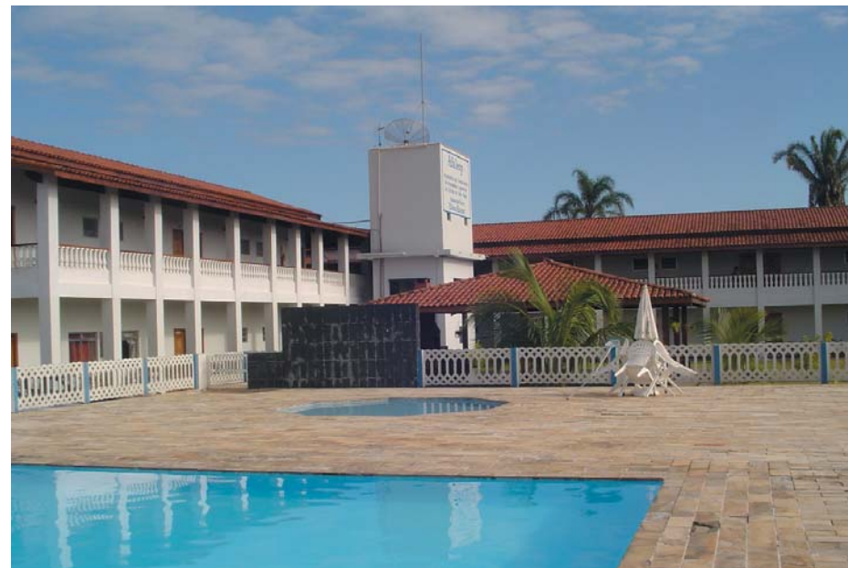
Colônia de Férias "Edson Kusma", em Caraguatatuba

Ao tentar contar a história da AFALESP, precisamos voltar bastante no tempo. Viajar para o ano de 1947. Mais exatamente, 9 de julho de 1947, data da promulgação da Constituição que marcou a redemocratização pós Estado Novo.