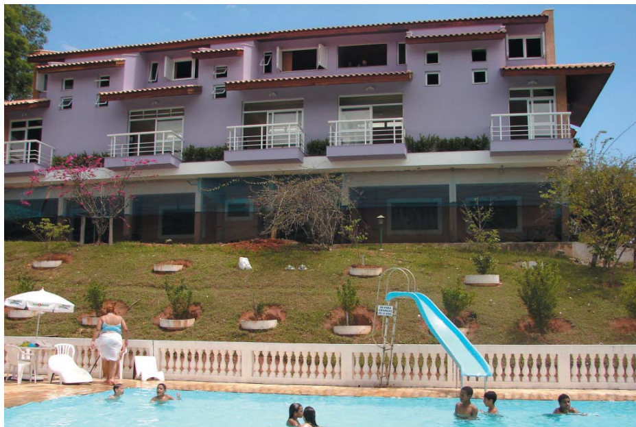
Ala nova da Colônia de Férias "José da Cruz Almeida", na Estância de Socorro