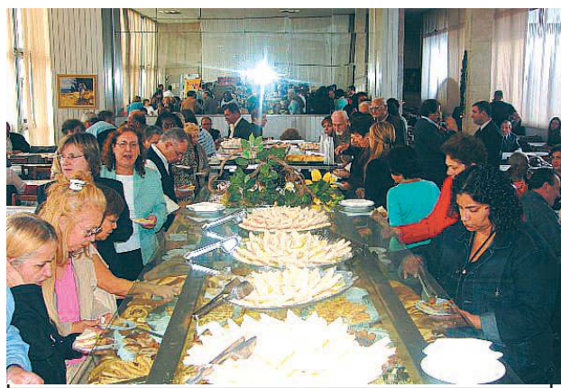
Chá dos Aposentados