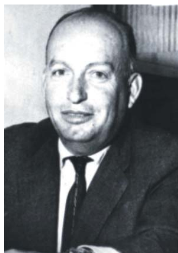
Francisco Quevedo (1964/1967)