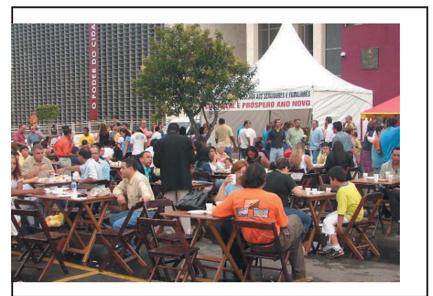
Confraternização de Fim de Ano